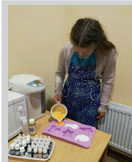
Schülerin gießt Seifenstücke