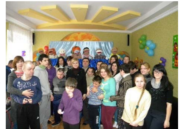
Schüler, Mitarbeiterinnen und Puppenspieler in der Schule der Gesellschaft Felicitas