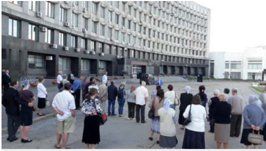
Tägliches Gebet um Frieden und für die Ukraine seit Beginn des Krieges im Donbass auf dem Majdan in Sumy

ges auf die Familien und auf die wirtschaftliche Lage in Sumy spürbar? Wie ist dazu Deine Sicht?