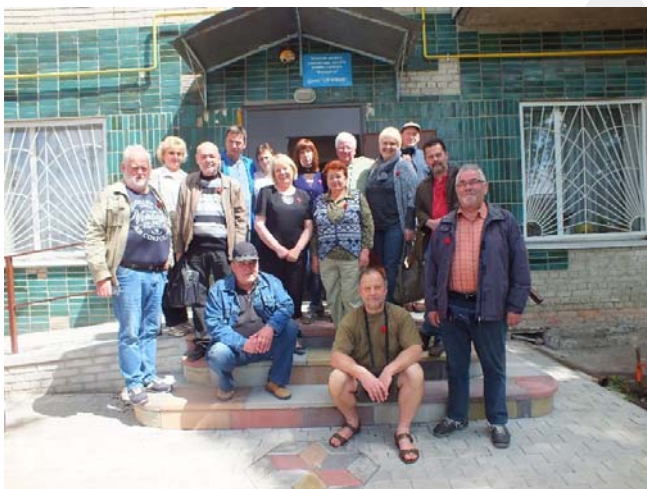
Die Fahrer des Spendentransports und MitarbeiterInnen vor der Schule in Sumy