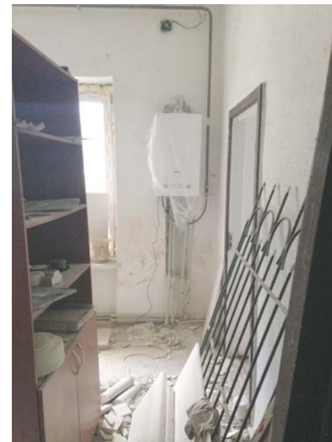
Die neu installierte Gasheizung in der Miniwerkstatt

Ein weiteres wichtiges Thema ist das Betreute Wohnen. Die „Gesellschaft Felicitas“ versucht dieses Vorhaben mit vielen Anträgen zu realisieren, aber es