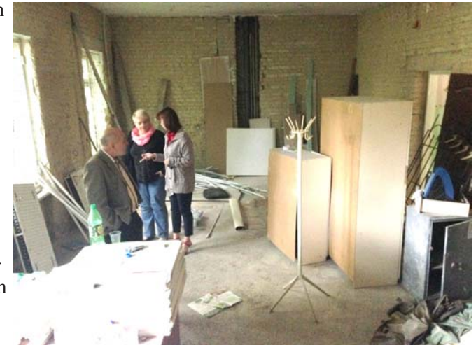
Der größte Raum in der Miniwerkstatt

Die Ladung der vier Kleinbusse bestand im Wesentlichen aus Rehabilitationsmitteln für Behinderte (so vom Sanitätshaus SoNa aus Jessen) und Verbrauchsmaterialien für den Kindergar-