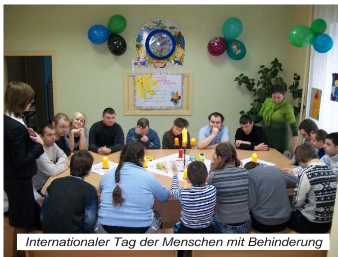
Internationaler Tag der Menschen mit Behinderung

Unsere Ziele sind die Tagesbetreuung der Schüler, die psychologische, pädagogische und soziale Rehabilitation und Habilitation, die sichere Beförderung der Schüler zum Förderzentrum und anderen sozialen Diensten und die Hausbesuchung. Schwerpunkte unserer Arbeit sind die Diagnostik, Beratung, sonderpädagogische Begleitung, Rechtsberatung und Prävention. Wir wollen, dass die Schüler ihre Fähigkeiten in allen Bereichen entwickeln können, und wir wollen sie bei der Integration in die Gesellschaft unterstützen. Das geschieht auch durch gemeinsames