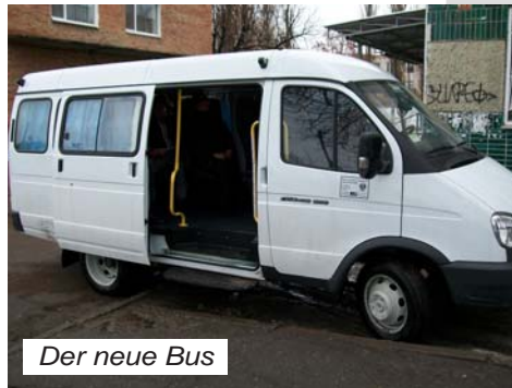
Der neue Bus

Mach Dich auf und handle! Und der Herr möge mit Dir sein! 1. Chr. 22, 16