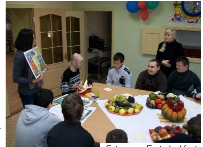
Fotos vom Erntedankfest