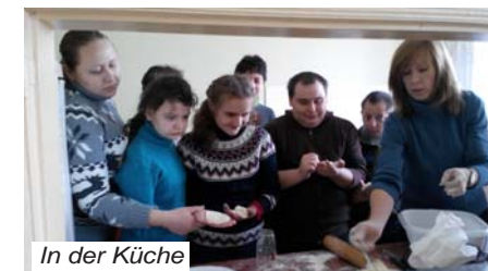
In der Küche